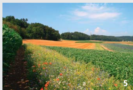
Dans le paysage rural, les bandes fleuries peuvent également jouer le rôle de corridors de liaison importants pour la faune, par exemple les carabes.