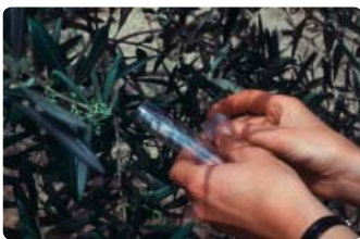
Lâcher de Metaphycus

L'essentiel de la régulation des populations de cochenille noire de l'olivier est assuré par les hyménoptères Metaphycus sp. et Scutellista cyanea .