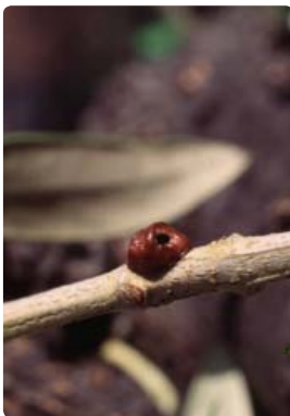
Cochenille détruite par Scutellista cyanea