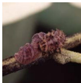
Larve de Chilocorus