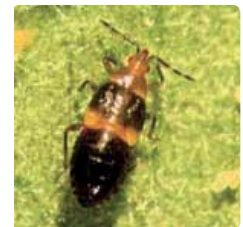
Larve d' Anthocoris