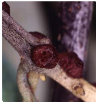
Cochenille parasitée par Metaphycus sp.

Ils ressemblent à de petites abeilles. Les adultes pondent dans les ravageurs et la larve se développe à leur dépens.