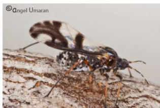
Adulte ailé avec des ailes très colorées