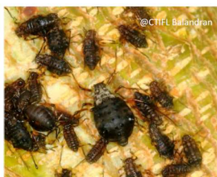
Aptère et larves

Pterochloroides persicae est un puceron (Hemiptera, Aphididae) qui vit en colonies sur les troncs et les branches des arbres fruitiers.