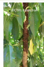
Colonie en « manchon »